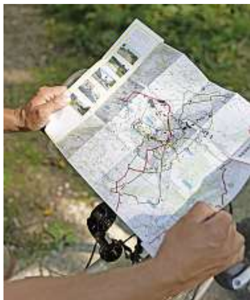
Les autorités tissent un réseau cyclable entre les communes de l'agglomération bulloise.

La capitale gruérienne semble donc être sur les bons rails, elle qui a reçu l'an passé un prix d'encouragement de Pro Velo Suisse pour son «engagement très focalisé, structuré et volontaire» en faveur des cyclistes. Le jury a relevé à cette occasion que «la voie choisie par Bulle était exemplaire, et à coup sûr encourageante pour d'autres communes de taille moyenne qui hésiteraient encore à se lancer, notamment en Suisse romande». Celles-ci se reconnaîtront. MM →