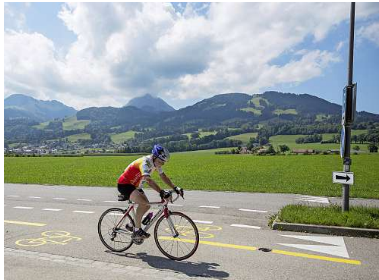
A Bulle, la petite reine n'est pas très populaire: la part des déplacements à vélo se monte à 2% seulement.

A la fin des années 1970, Bulle (FR) et La Tour-de-Trême (FR) comptaient à peine 10 000 âmes. Aujourd'hui, la population de ces deux communes, qui ont fusionné depuis, dépasse les 22 000 habitants. Avec l'arrivée de l'autoroute en 1981, la démographie du chef-lieu de la Gruyère a donc littéralement explosé. Et le trafic aussi, malgré l'ouverture fin 2009 de la route de contournement H189.